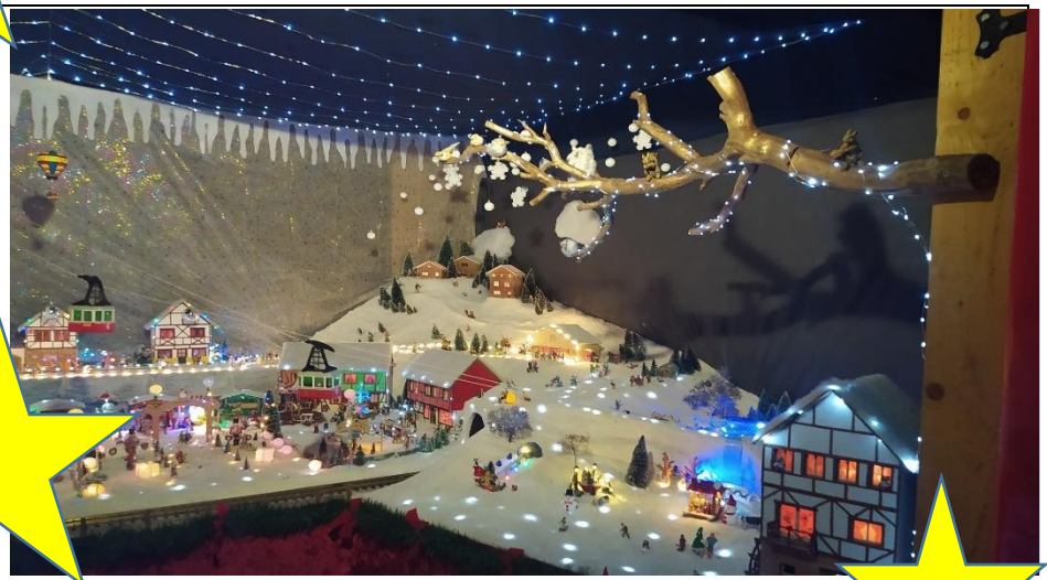
La crèche à l'église