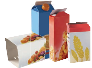
Briques et emballages en carton