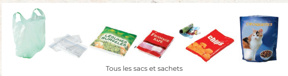
Tous les sacs et sachets