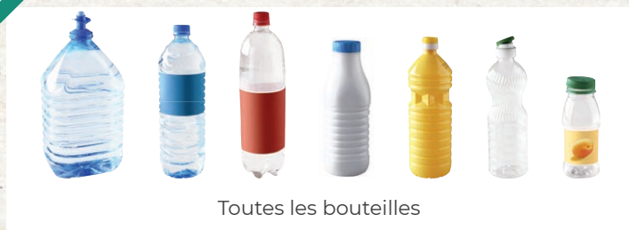
Toutes les bouteilles