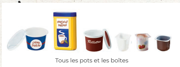
Tous les pots et les boîtes