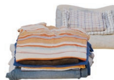
Textiles (linge de maison, vêtements, chaussures)