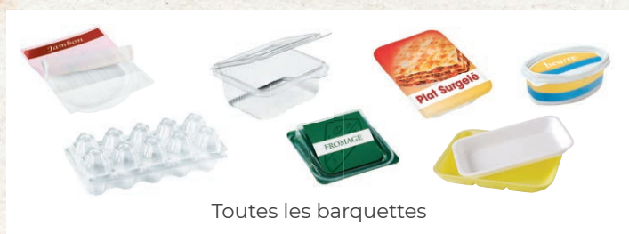
Toutes les barquettes