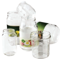
Pots et bocaux en verre