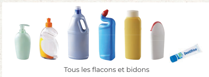
Tous les flacons et bidons