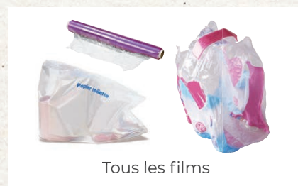
Tous les films