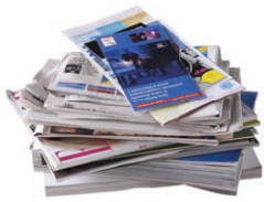
Tous les papiers (séparés de leur emballage plastique)