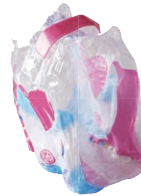
Tous les autres emballages en plastique